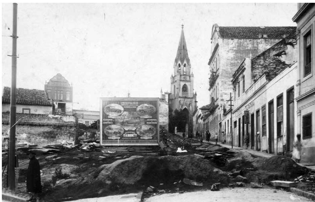
Depois que a quadra deu lugar a uma praça, a visibilidade da igreja aumentou consideravelmente

Era para acontecer nele a primeira Assembleia da Federação Mundial no Hemisfério Sul. Este sonho foi frustrado, quando delegados europeus se negaram a vir para o Brasil em protesto contra a ditadura. Com