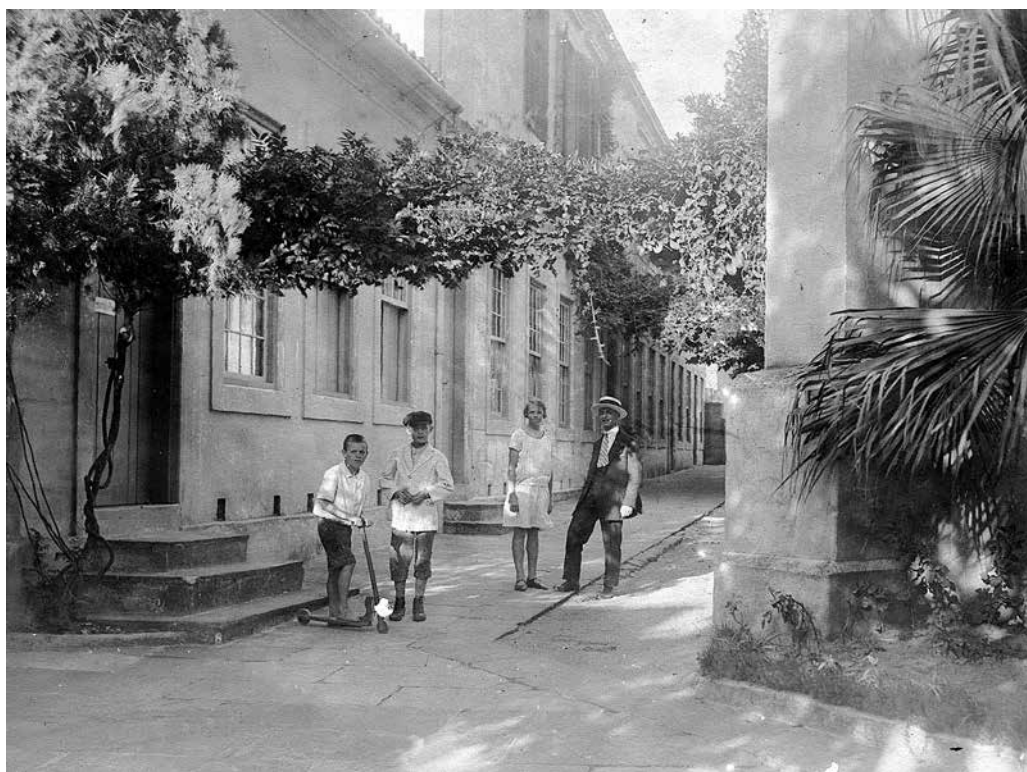
Poucas fotos captaram o espaço do pátio da igreja antiga

De uma sala alugada, passaram a planejar a construção de um templo próprio. Cinco anos depois, surgia a Igreja de Cristo na Rua Senhor dos Passos. Era uma igreja simples, sem torre, pois isto era proibido durante a monarquia. Ali a pequena e jovem comunidade já en-