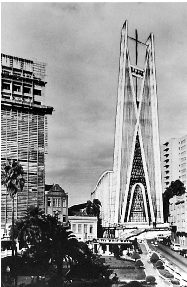
Outros projetos arquitetônicos foram apresentados mas não venceram o concurso para o novo templo

o propósito de superar esse trauma, surgiu a ideia de batizar o novo templo com o nome de Igreja da Reconciliação.