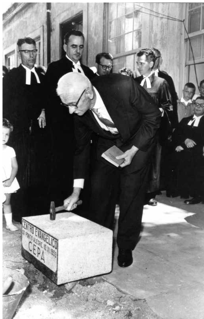
No dia 15 de novembro de 1959 foi lançada a pedra fundamental do novo Centro Evangélico