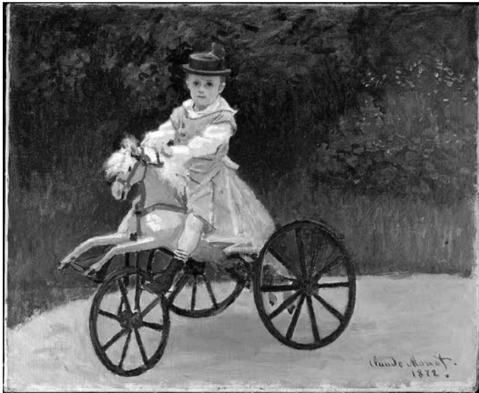
Foto: Jean Monet on His Hobby Horse by Claude Monet, 1872, Metropolitan Museum of Art

Na minha escrivaninha tem um cartão postal que mostra um menino vestido à moda do século XIX, sentado num triciclo. Trata-se do filho do pintor francês Claude Monet, que viveu de 1840 a 1926.