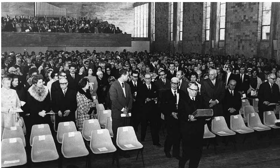
Com a nova igreja superlotada de membros e autoridades, líderes leigos da comunidade entram solenemente trazendo os elementos do altar no culto de dedicação da Igreja da Reconciliação.

O Ensino Confirmatório tinha uma média de 70 a 80 confirmandos por ano e possuía quatro turmas. O Estudo Bíblico reunia-se semanalmente. O DECA era um grupo de estudos que reunia jovens com mais de 19 anos e buscava a meditação, a educação, a cultura e a assistência social. A JEAS reunia jovens provenientes do ensino confirmatório até 19 anos aos sábados à tarde. O chamado "O Grupo" reunia aos domingos à noite jovens acima de 18 anos, na maioria vindos da JEAS.